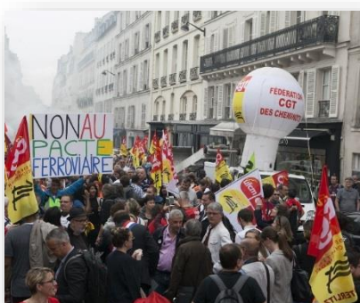
Paris, le 29 mai 2018

Les cheminots entament la 14 e séquence de grève de 2 jours sur 5. Malgré les pièges tendus par le gouvernement et les attaques incessantes de la SNCF, la mobilisation et l'unité syndicale sont toujours au rendez-vous.