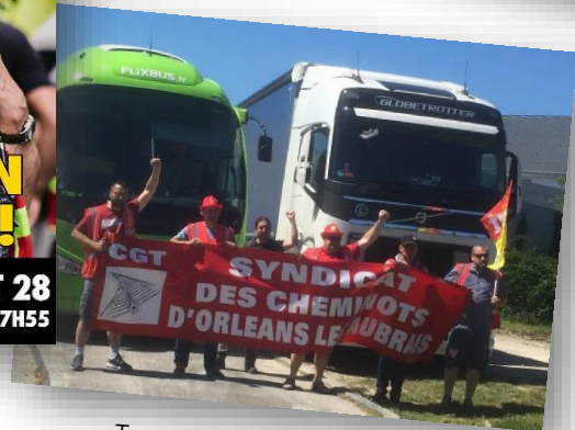
Tours, le 22 juin 2018

TOUS EN GRÈVE LES 27 ET 28 PRÉAVIS DU 26 JUIN 20H AU 29 JUIN 7H55