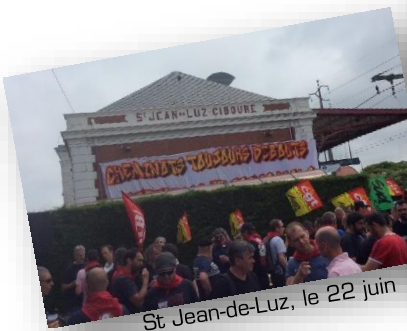
St Jean-de-Luz, le 22 juin