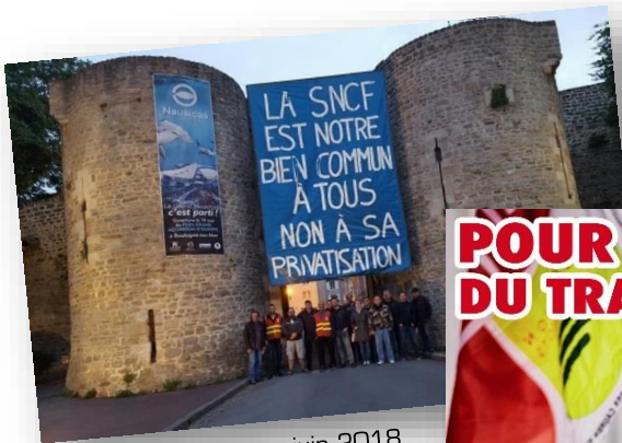
Boulogne, juin 2018