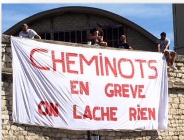
Nîmes, le 22 juin 2018

La SNCF, certains veulent la descendre, NOUS on continue de la défendre !