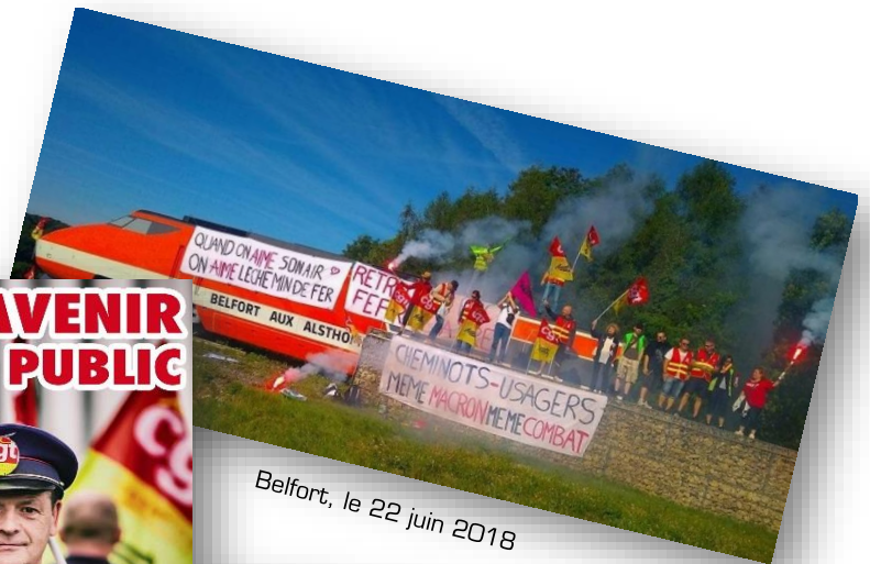
Belfort, le 22 juin 2018