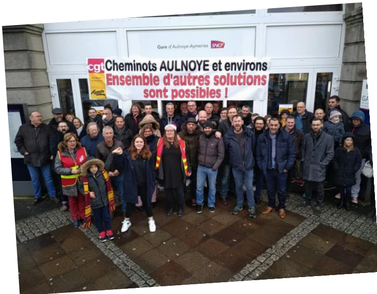
Noël des grévistes - Aulnoye