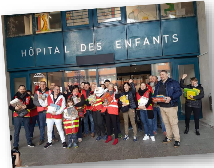
Toulouse le 25/12