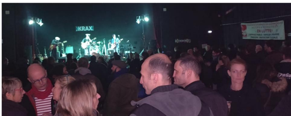
Concert des luttes à Clermont-Ferrand le 03 janvier 2020

Les sondages ont beau être tordus dans tous les sens, les questions ont beau être orientées, ils n'arrivent pas à gommer la réalité : la population est très largement hostile à cette réforme !