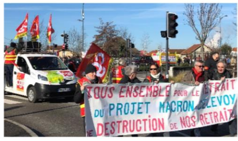
Bourgoin-Jallieu le 20 février

Alors, mieux vaut tard que jamais si, aujourd'hui, quelques-uns s'aperçoivent enfin que la préservation de la planète passe par le développement du ferroviaire, que le wagon isolé pourrait être la solution et que la fédération CGT des cheminots avait raison !