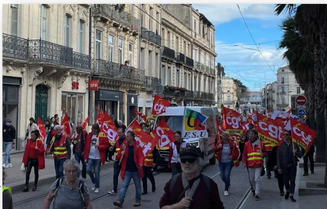
Montpellier, le 11 mars 2023.

Rejoindre la CGT, c'est débattre, proposer, revendiquer, agir et lutter collectivement.