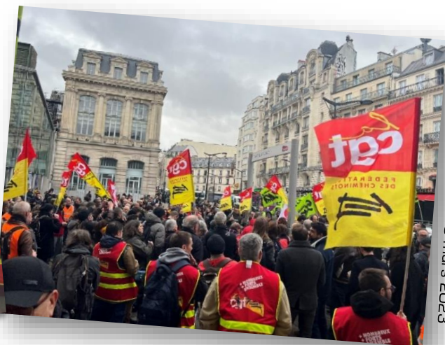
Paris Nord, le 13 mars 2023

Pour être plus fort, vous aussi, adhérez à la CGT !