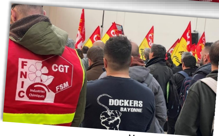
Montreuil, le 2 mars 2023