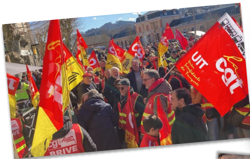
Brive, le 7 mars 2023

LE 15 MARS PROCHAIN, À L'APPEL DE L'INTERSYNDICALE, SOYONS MASSIVEMENT EN GRÈVE ET DANS LES RUES !