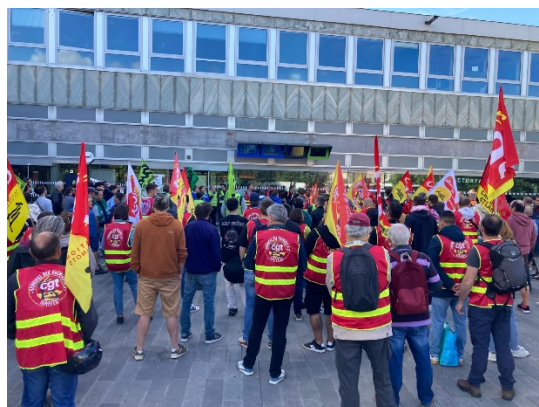
AG de cheminots à Nantes