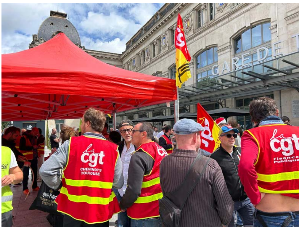
AG de cheminots devant la Gare de Toulouse Matabiau

Il s'agit bien d'une journée de grève TOUS-TES CHEMINOT-ES !