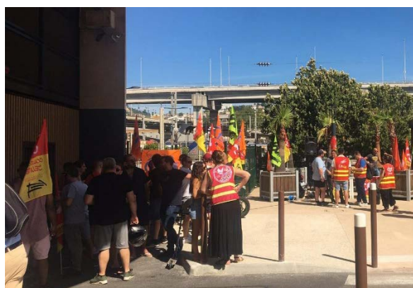
AG de cheminots dans la filiale SVSA