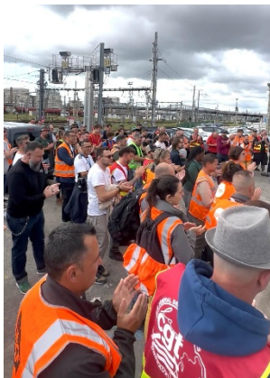
AG de cheminots à Bordeaux

Des taux de grévistes à Réseau à hauteur de 35 % sur l'ensemble du territoire, avec des participations à 100 % sur des dizaines de brigades (Miramas, les Arcs, Fréjus, Saint Charles...)