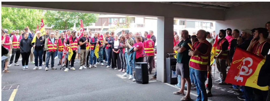
AG de cheminots à l'EIC Auvergne

UNE TABLE RONDE DE NÉGOCIATION DOIT ÊTRE DÉCLENCHÉE DANS LES PLUS BREFS DÉLAIS !