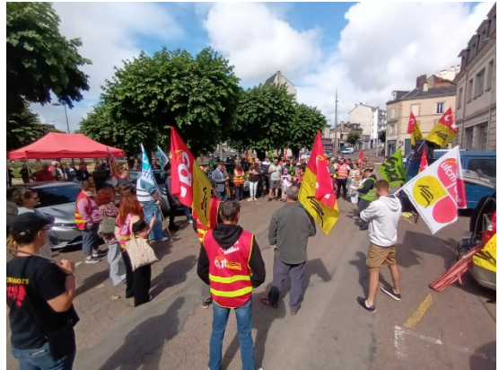
AG de cheminots à Limoges

Pour la CGT, et à l'heure où s'écrivent ces lignes, la poursuite du processus revendicatif unitaire est une nécessité !