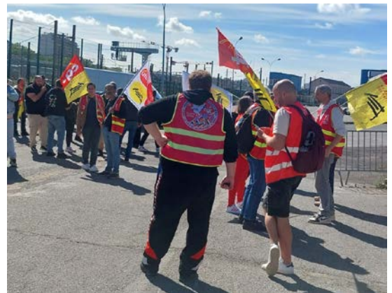
Interpellation de la Direction à l'Infrapôle de PSE

POUR LES DROITS DES CHEMINOT-ES ! POUR UN SERVICE PUBLIC QUI RÉPONDE AUX BESOINS DES USAGER-ES !